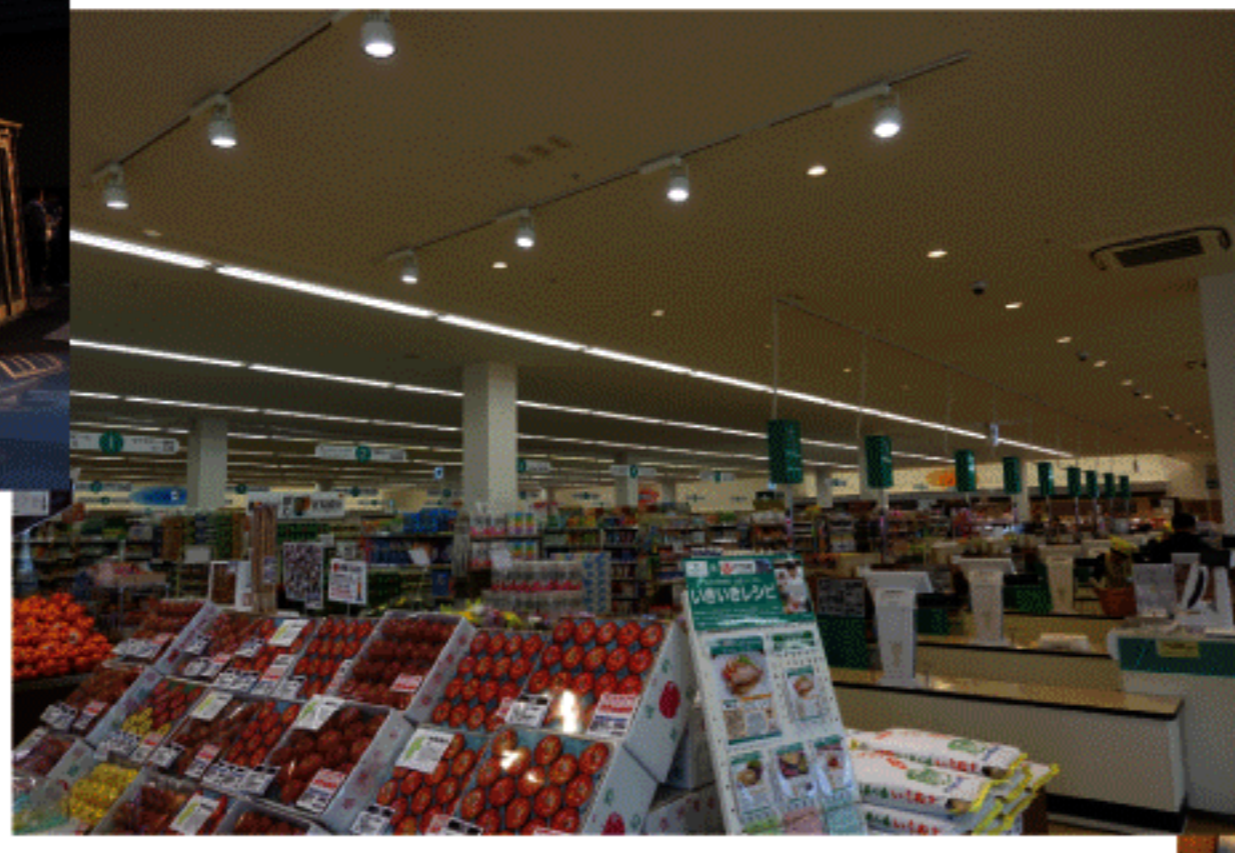
飯山駅前の大きなスーパー